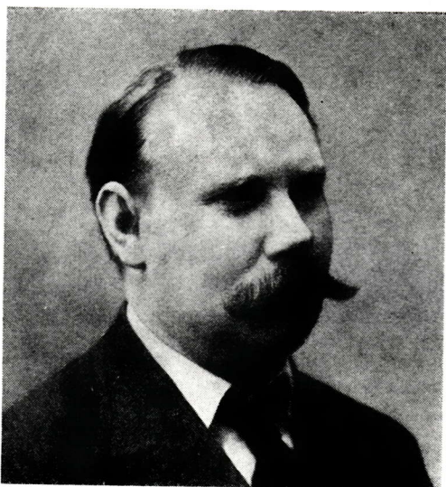
Et af de sidste billeder af Peter Sabroe.

Det er altid problematisk at søge at fremstille mennesker, der har levet, historiske personligheder, på scene eller film. Hvor mange af de Napoleon'er, der har tyranniseret alverdens teatre, har mon mindet noget videre om den lille imperator, som han virkelig var? Man ville også nok kunne se forskel, hvis det var muligt at placere den fortræffelige Paul Muni i hans maskeringer side og side med den virkelige Zola og Pasteur . Og Greer Garson gik som Madame Curie endog den vej, at hun slet ikke søgte at nærme sig en ydre lighed med sit forbillede.