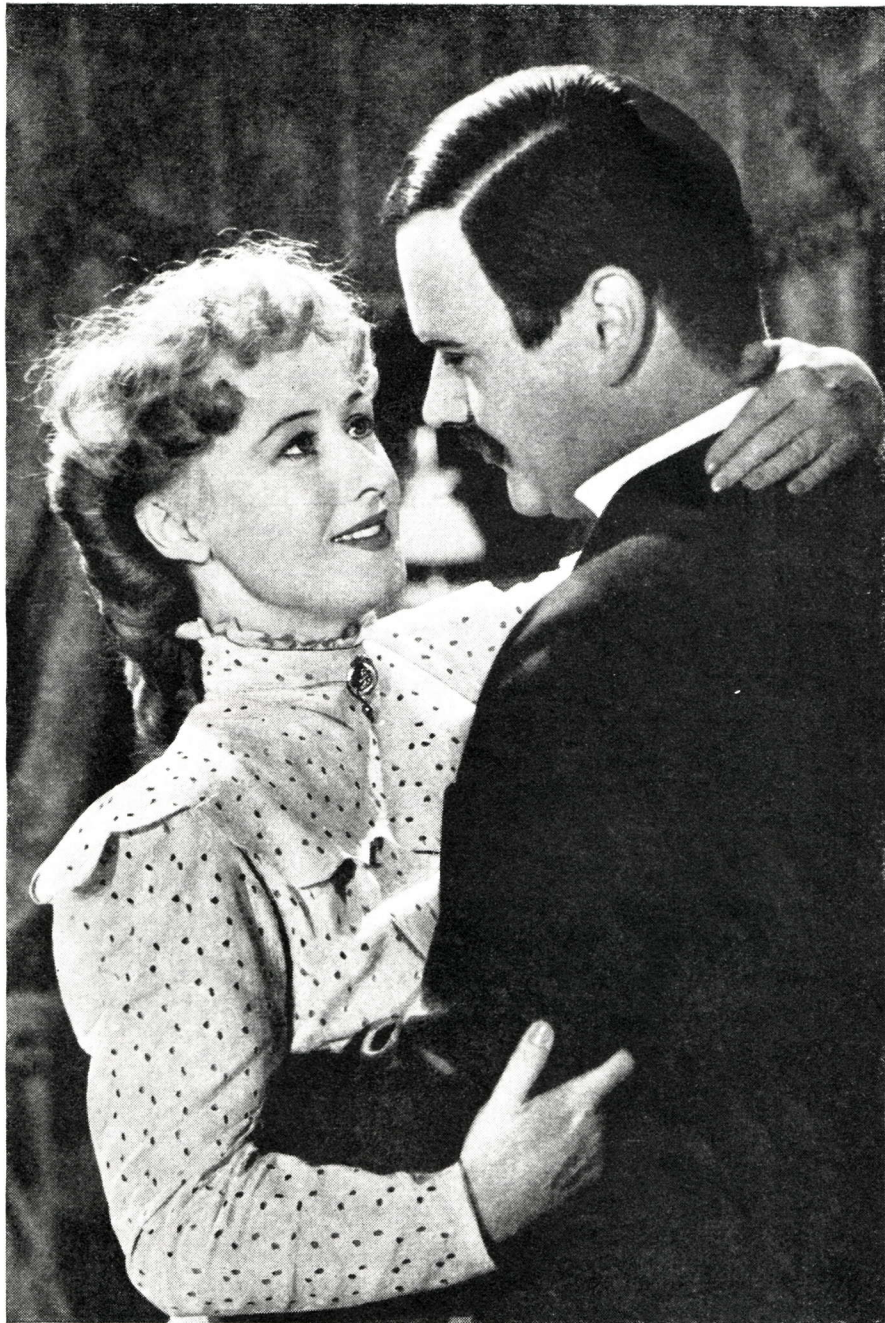
I de unge lykkelige år.