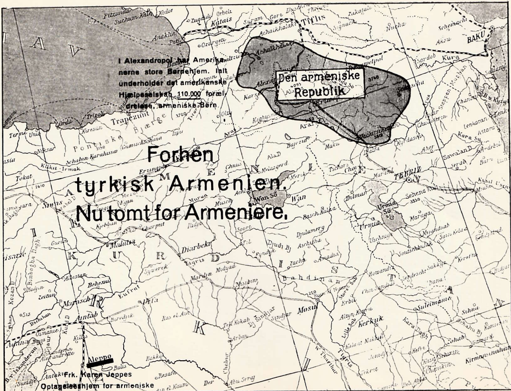
Kort over Armenien.