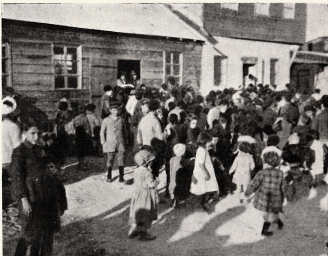
Børn ved Suppekøkkenet

Vi bestræber os for ikke blot at give dem Undervisning i de almindelige Skolefag, men ogsaa for at faa dem uddannede i et Haandværk, saa de virkelig kan have en Fremtid at se hen til. Det skulde gaa