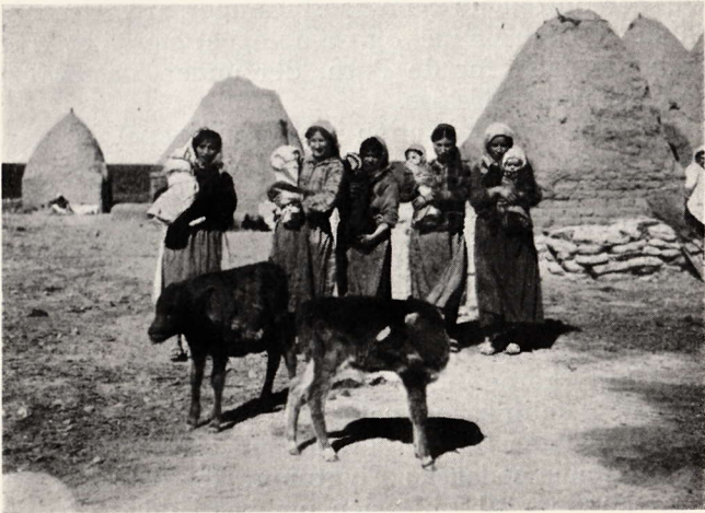
Kvinder uden for en Landsby

stematiske Arbejde med at udrydde et Folk. Herom fortæller Fridtjof Nansen: „Det første Skridt var at arrestere 600 ledende Armeniere i Konstantinopel i April 1915. De blev sendt til Lilleasien, hvor de forsvandt, og man har siden kun hørt om otte af dem. Saaledes var Munden stoppet paa Armeniernes vigtigste Talsmænd. Og i Juni 1915 begyndte Ræds-