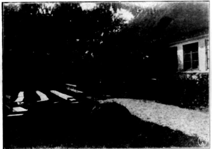
Vejgaardens Have paa Taasinge. Paa Trappen holdt Sabroe sit sidste Foredrag.